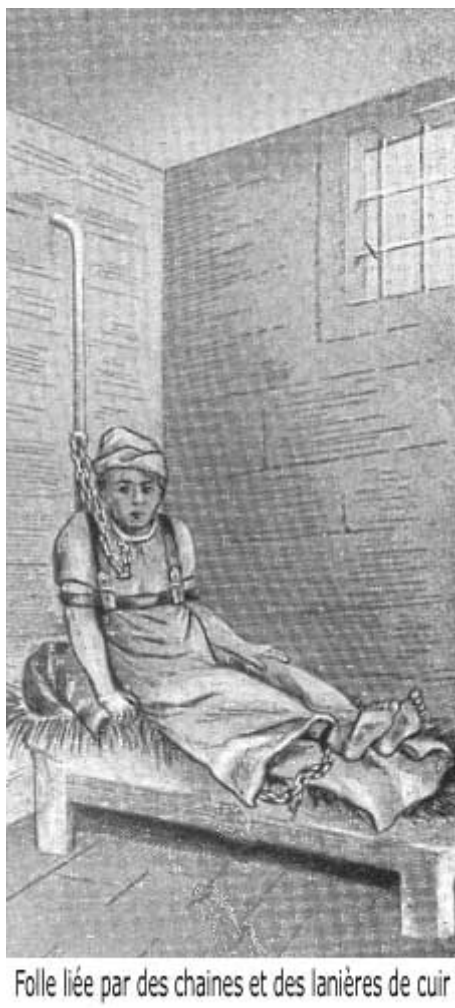
Folle liée par des chaînes et des lanières de cuir

Dans les lieux d'internement, les insensés ne sont pas séparés des correctionnaires (mendiants, criminels...), ils ne reçoivent aucun traitement spécial. L'enfermement dans des chambres à l'allure de cachot, la contention pour les plus agités, tiennent lieu de traitement de la folie. La guérison étant le plus souvent jugée hors d'atteinte, les soins sont alors prodigués dans l'unique but de contrôler le comportement des malades. Ces soins consistent en majorité en des chocs destinés à calmer : bains forcés, châtiments corporels, détonations... Mais l'ordinaire est la contention, chaînes, lits et fauteuils munis de sangles, combinaisons (ancêtre de nos camisoles de force) sont utilisés en effet quotidiennement 32 .